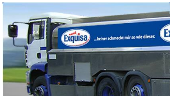
Exquisa – eine starke Marke der Karwendel-Werke.

Das erfolgreiche Familienunternehmen mit Sitz in Buchloe im Allgäu ist eines der bedeutendsten privaten Molkereiunternehmen in Deutschland. Für seine Frischkäse-, Quark- und Käsespezialitäten, die unter so bekannten Markennamen wie Exquisa und miree vertrieben werden, verarbeitet Karwendel mit seinen rund 360 Mitarbeitern jährlich über 170 Mio. Liter Milch. Damit ist das Unternehmen einer der größten Arbeitgeber und Ausbildungsbetriebe in seiner Region.